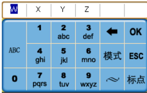
图 7 英文大写输入示例