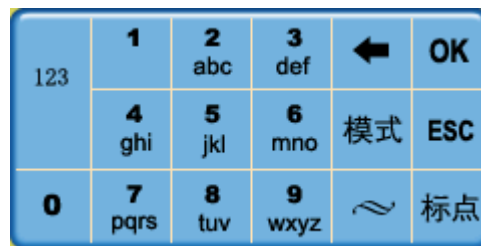
图 6 数字输入模式

在数字输入模式下，用户可以进行数字串的输入。输入的数字直接送到目标文本中。如图 6 所示：