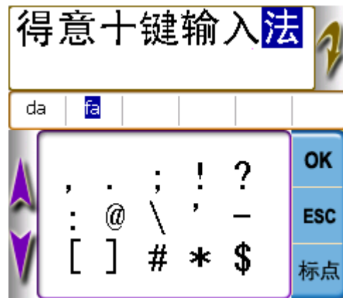
图10 半角标点候选示意