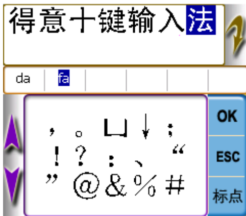
图9 全角标点候选示意

在任何输入方式下，按右下角的“标点”键，都可以进行标点符号的输入。按第一下出的是全角符号候选（如图9所示，其中“□”表示空格，“↓”表示回车），按第二下出的是半角符号候选（如图10所示），按第三下关闭标点符号候选框。触摸想要输入的标点符号即可发送到目标文本中，如果整句编辑框有输入，则已输入的内容会先发送出去。