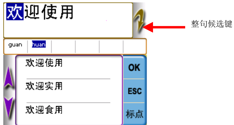
图 5 整句候选示例