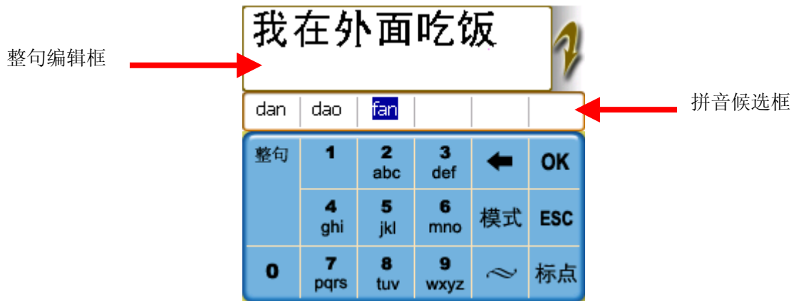
图3 拼音整句输入示例

在汉字的输入过程中，用户无需每输完一个拼音后去修改汉字，可以连续输入拼音串，等句子输入完后，如果有汉字选择错误的话，可以触摸选中要修改的汉字，这时会弹出一个汉字候选框，用户触摸即可选中想要输入的汉字。当候选的汉字多于一页时，可以按上/下翻页键（见下面图4示意）进行翻页选择。选中一个汉字或按“ESC”键可以关闭汉字候选框。如图4所示：